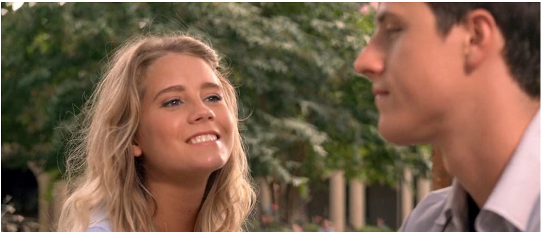
Kara, la fidanzata di Josh, cerca di dissuaderlo, preoccupata per il loro futuro insieme.