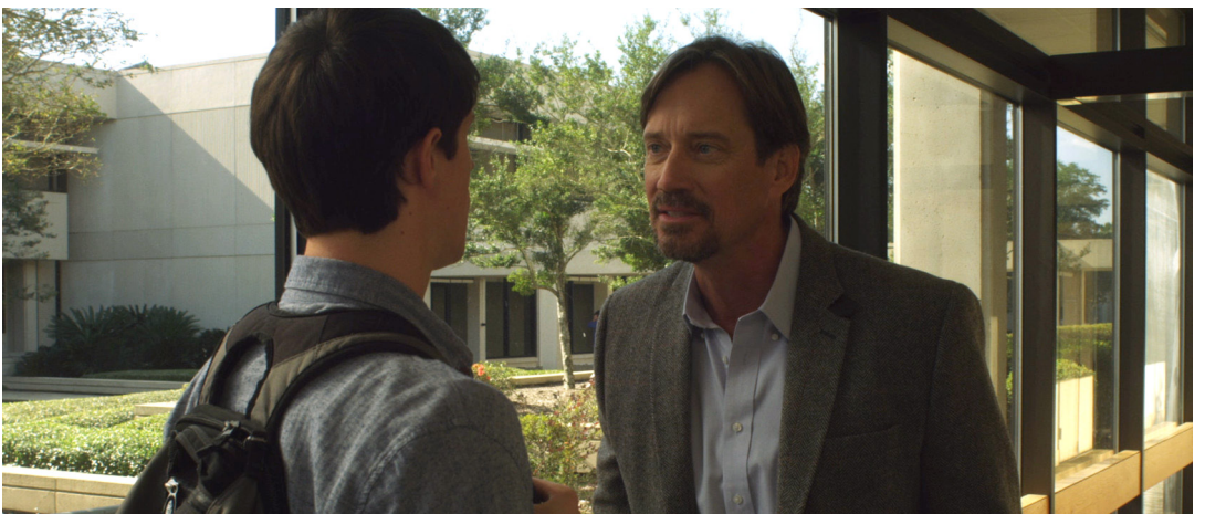
Josh è determinato a difendere Dio ma il Professor Radisson è pronto a contrastarlo con ogni mezzo.