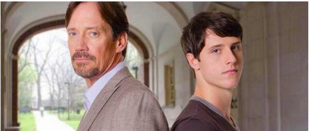
A cosa porterà il confronto tra insegnante e alunno?