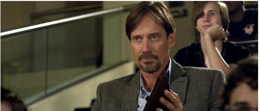
Kevin Sorbo, nel ruolo del Professor Radisson.