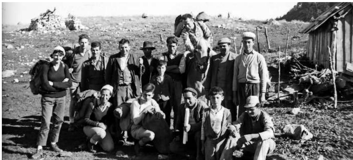
Calabria 61