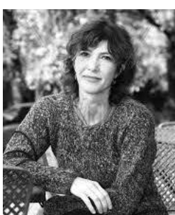
Maria Amelia Monti