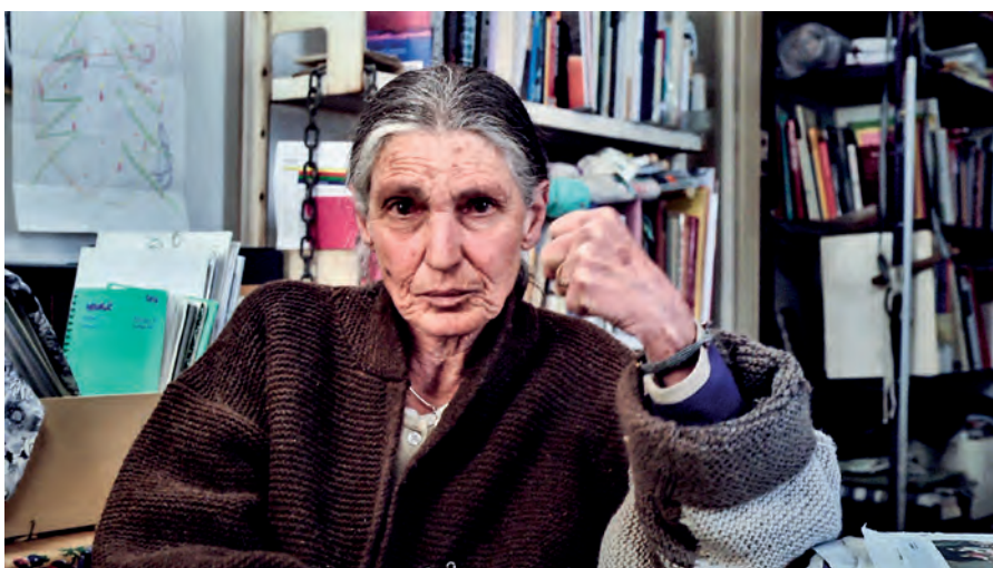
BENEDETTA BARZINI modella e maestra di stile