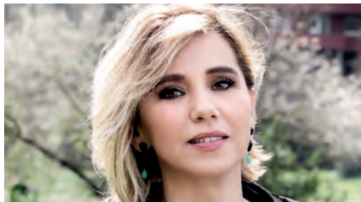
Concita De Gregorio

Giornalista, scrittrice e firma storica de La Repubblica . Autrice di romanzi e saggi molti dei quali pubblicati da Einaudi, Feltrinelli, Rizzoli. È ideatrice e conduttrice del format Fuoriroma per Raitre. Prossima al debutto la versione teatrale del suo testo Mi sa che fuori è primavera (Feltrinelli 2015) per la regia di Giorgio Barberio Corsetti. Nel 2014 ha fondato la casa di produzione Dora Maar . Lievito madre , nato dal progetto Cosa pensano le ragazze , è il suo primo lavoro per il cinema.