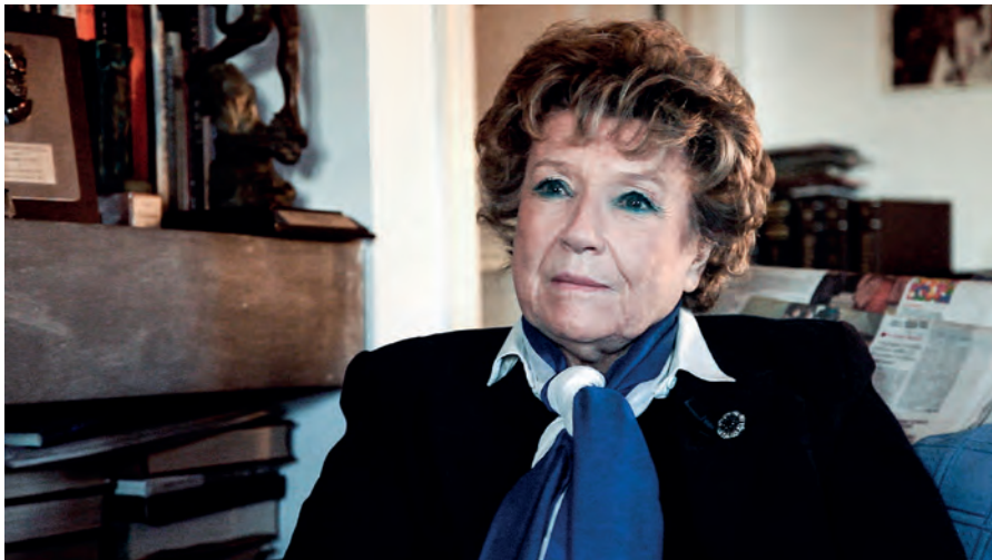
DACIA MARAINI che ascolta voci e scrive libri