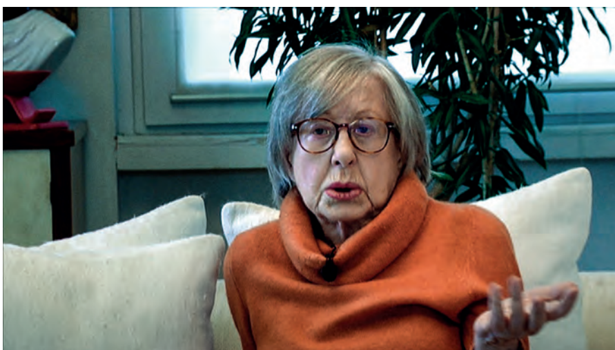
NATALIA ASPESI che quando scrive ci spiega chi siamo