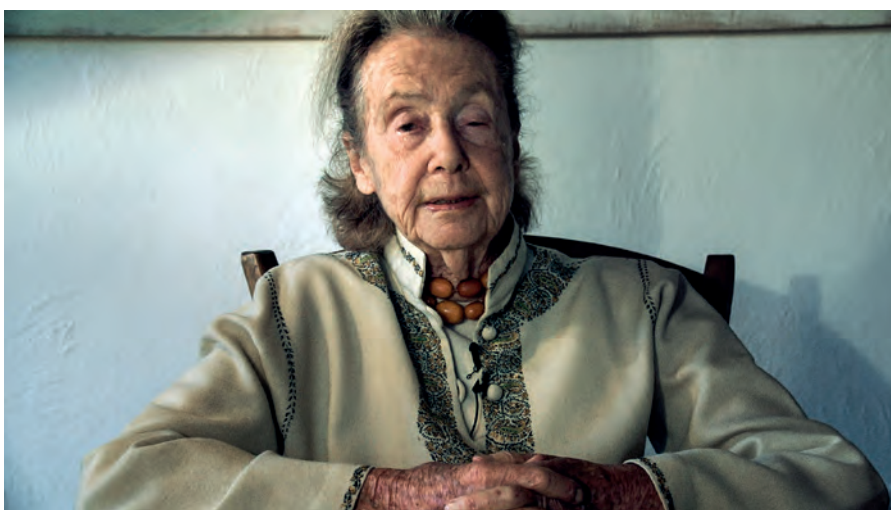
GIULIA MARIA CRESPI che è stata anche editrice del Corriere della sera