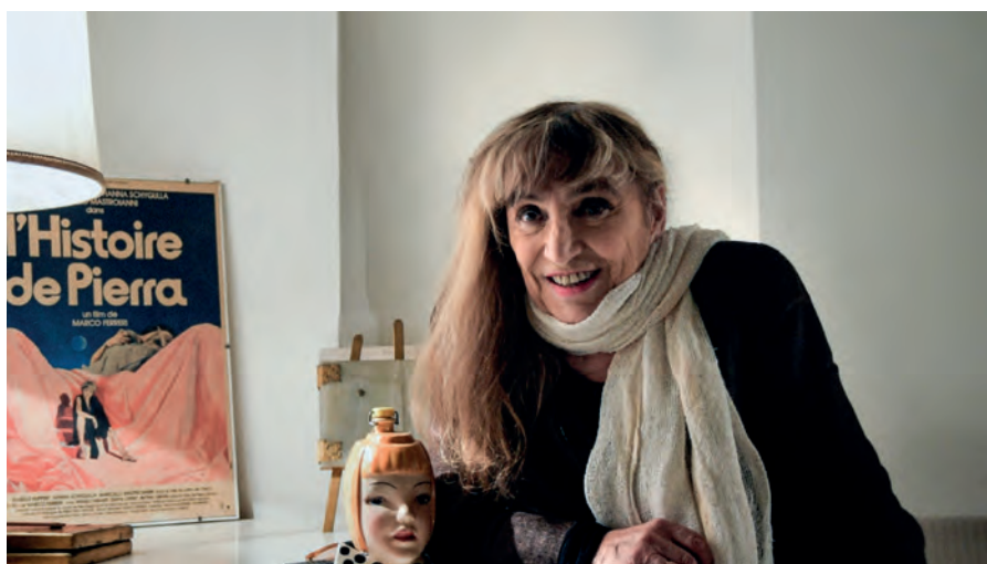
PIERA DEGLI ESPOSTI attrice e perla dell'Adriatico