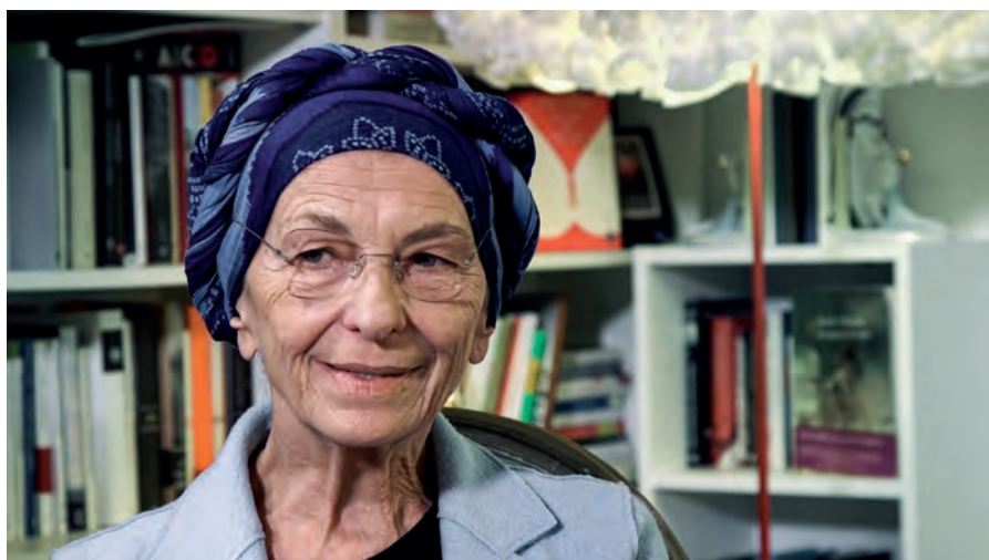
EMMA BONINO che si è sempre sentita figlia e fa politica