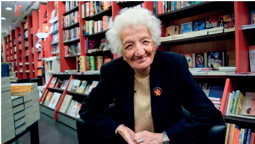
CECILIA MANGINI che vede il mondo dal suo obiettivo