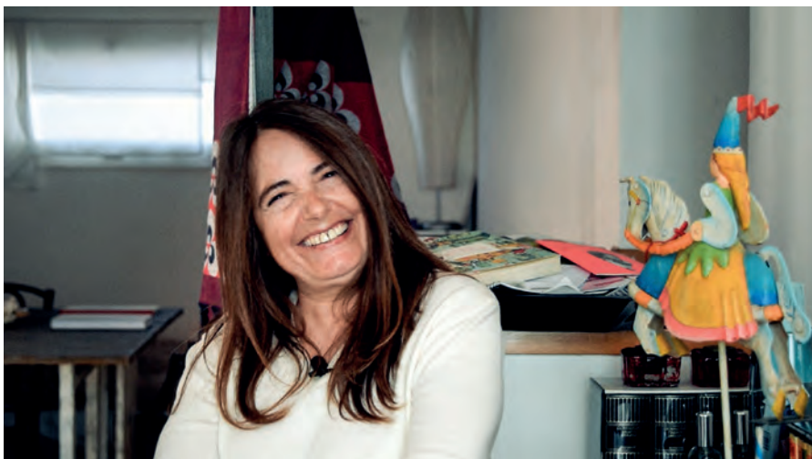
NADA MALANIMA che canta recita e scrive